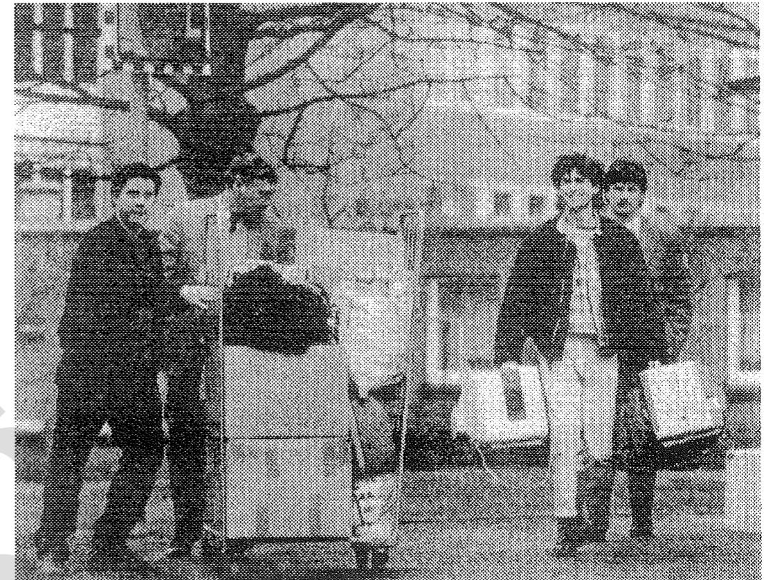
Sofortige Einstellung des Verfahrens !!!

– setzt das berüchtigte Itzehoer Landrecht wie z.Z. der AKW Prozesse fort (Zeit damals: "Bürgerkriegsjustiz", Süddeutsche Zeitung: "Politisch gefärbte Justiz").